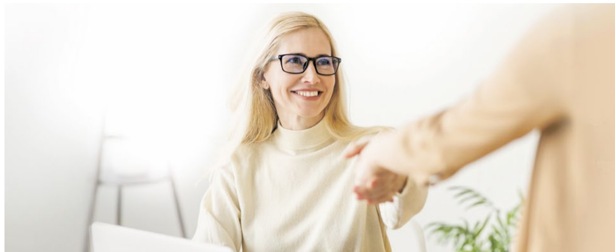
Die Systemlösung für erfolgreiches Recruiting von Vincentz Network besteht aus fünf verschiedenen Modulen.

Vincentz Network unterstützt die Branche mit „Vincentz Personal – Mitarbeiter finden & binden“ – einer Systemlösung für erfolgreiches Recruiting mit unterschiedlichen Produkten.