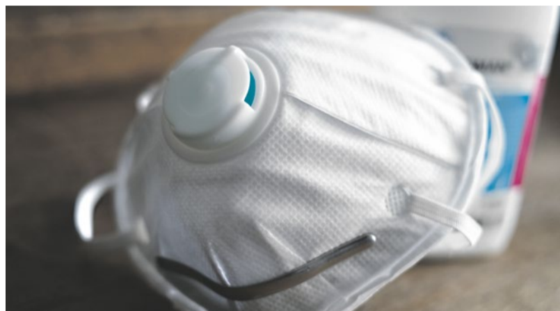
Lieferengpässe bei Hygiene- und Hilfsmitteln stellen die Einrichtungen aktuell vor große Herausforderungen.