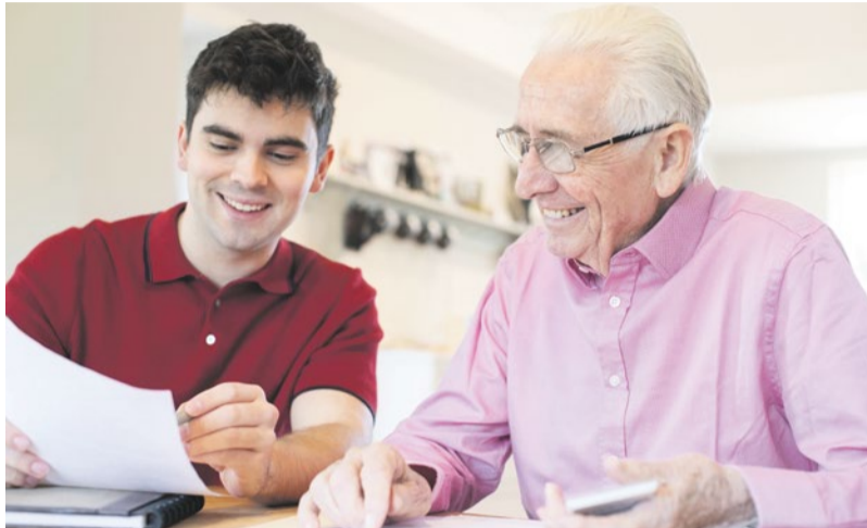
Viele Pflegegeldempfänger schätzen die Tipps der Pflegekräfte.